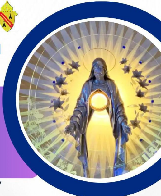
Basilica de la Inmaculada Niepokalanów, Polonia