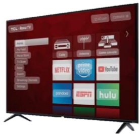
1 st prize Smart TV TCL-Roku 65"

El costo será de $5 por boleto o $20 por 5 boletos y los puedes adquirir después de las misas o en la oficina. La rifa se llevará a cabo el 28 de Julio durante la Kermes Parroquial.