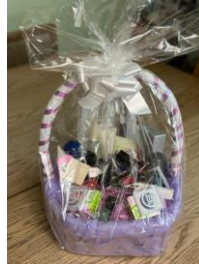
3 rd prize Beauty Basket