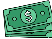
5 th prize $150.00 Cash