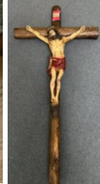
4 th prize Crucifix 3'1" Crucifijo