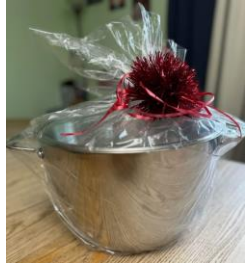
2 nd prize Princess House 16-Qt Stockpot