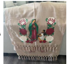
6 th Prize Women's Shawl Rebozo